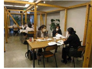
SAGA CHIKAにてグループ活動