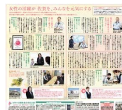
(参考) 令和3年3月8日佐賀新聞掲載