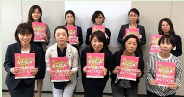
▲ 第7期ワーキンググループメンバー

Jump Up Women SAGA （ワーキンググループ）を組織し、「重点活動項目」に資する事業についての検討や調査、自己研鑽など、経済界のリーダー（企画委員会）の下、核となり活動しています。