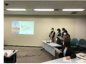
発表会に向けてのプレプレゼンの様子