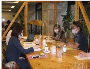
産業人材課ヘインタビュー