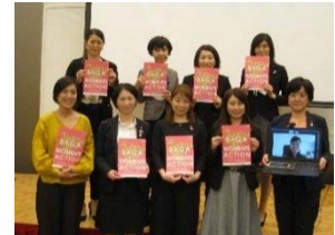
（令和3年3月18日 第6期メンバー 活動成果発表会）