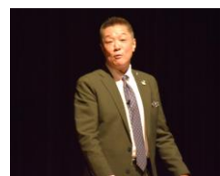
講師はとても気さくな方で、控室ではいろいろなお話を聞くことができました。