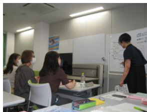
講師を迎えてチラシデザインの検討