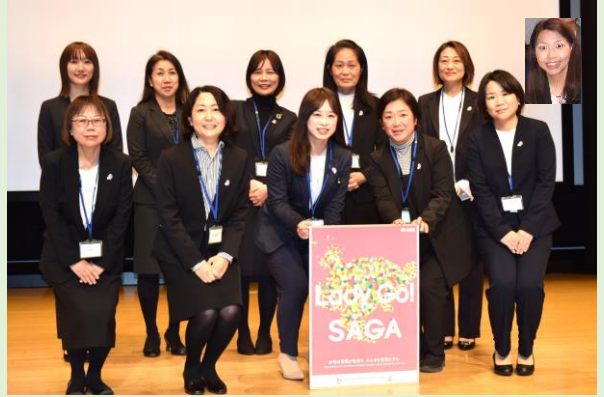
▲ 第9期ワーキンググループメンバー

Jump Up Women SAGA （ワーキンググループ）を組織し、「重点活動項目」に資する事業についての検討や調査、自己研鑽など、経済界のリーダー（企画委員会）の下、核となり活動しています。