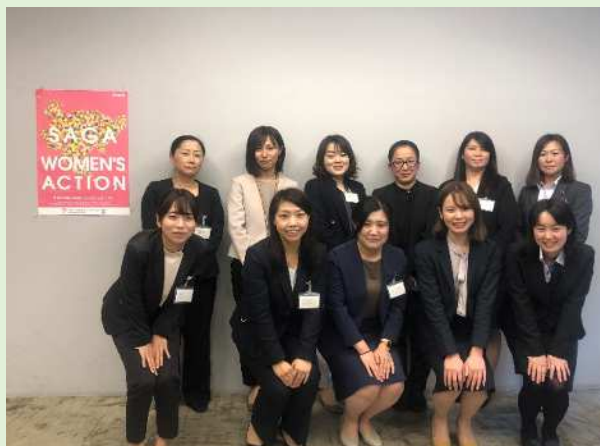
▲ 第8期ワーキンググループメンバー

Jump Up Women SAGA （ワーキンググループ）を組織し、「重点活動項目」に資する事業についての検討や調査、自己研鑽など、経済界のリーダー（企画委員会）の下、核となり活動しています。