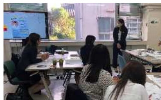
講演会詳細検討／準備