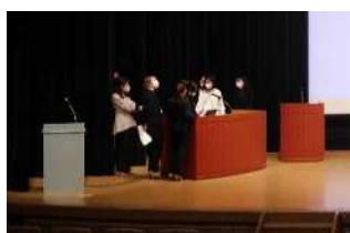
講演会リハーサル