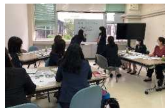
講演会詳細検討／準備