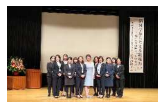
黒川先生(講師)と一緒に