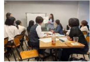
講演会詳細検討／準備