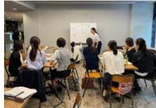
講演会詳細検討／準備