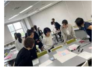
講演会のテーマ決め