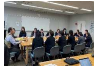
福地氏(講師)と意見交換